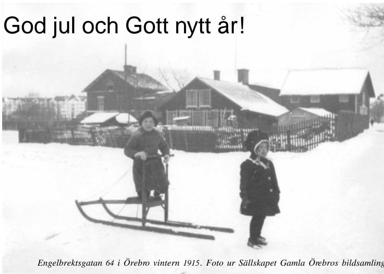
Engelbrektsgratan 64 i Örebro vintern 1915.

Styrelse och personal tillönskar alla medlemsorganisationer, anslagsbeviljande myndigheter, arkivkolleger och kontakter i övrigt En riktig God Jul och Ett Gott Nytt År med ett stort tack för ett synnerligen gott och positivt samarbete under 1997.