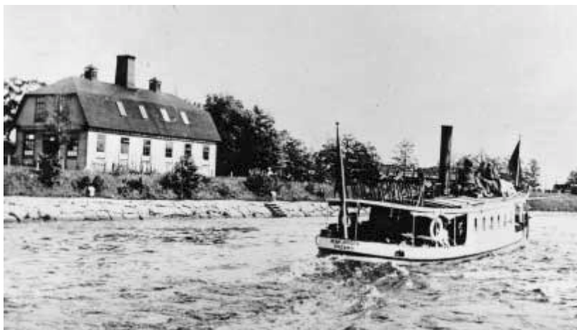
Ångslupen Hemfjärden passerar Örebro Nya Ångfärgeri och Kemiska Tvättanstält vid Slussen.