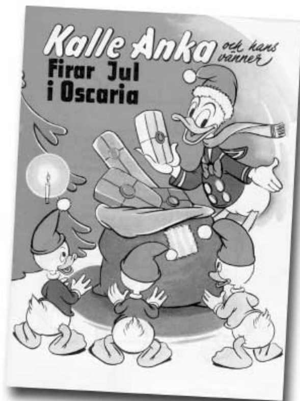
Reklambroschyr från 1949 ur Oskarier arkiv.

Att folkrörelse- och företagsarkiven nu finns tillsammans i ArkivCentrums lokaler är mångas förtjänst. Särskilt betydelsefullt har stödet från Örebro läns landsting och länsstyrelsen varit. Många goda krafter har samverkat till det lyckosamma resultatet. Styrelserna för de bägge arkiven sänder ett stort och varmt tack till alla som gjort 1998 till ett märkesår för arkivsaken i Örebro län.