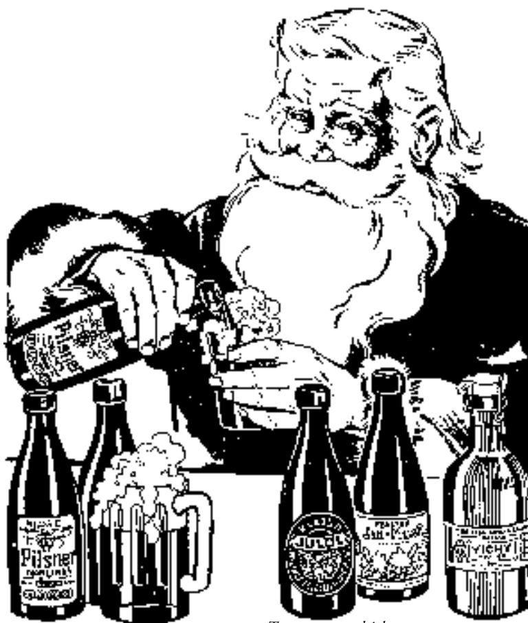
Tomten gör en drickapaus. Ur reklam för Norlings bryggeri julen 1939.