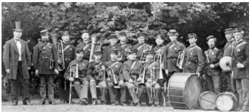
Örebro Skarpskyttars musikkår laddar upp för insats med pukor och trumpeter.

Den anrika fackföreningen Svenska järnvägsmannaförbundet avdelning 50:s arkiv har vid ett flertal tillfällen under hösten kompletterats med material från