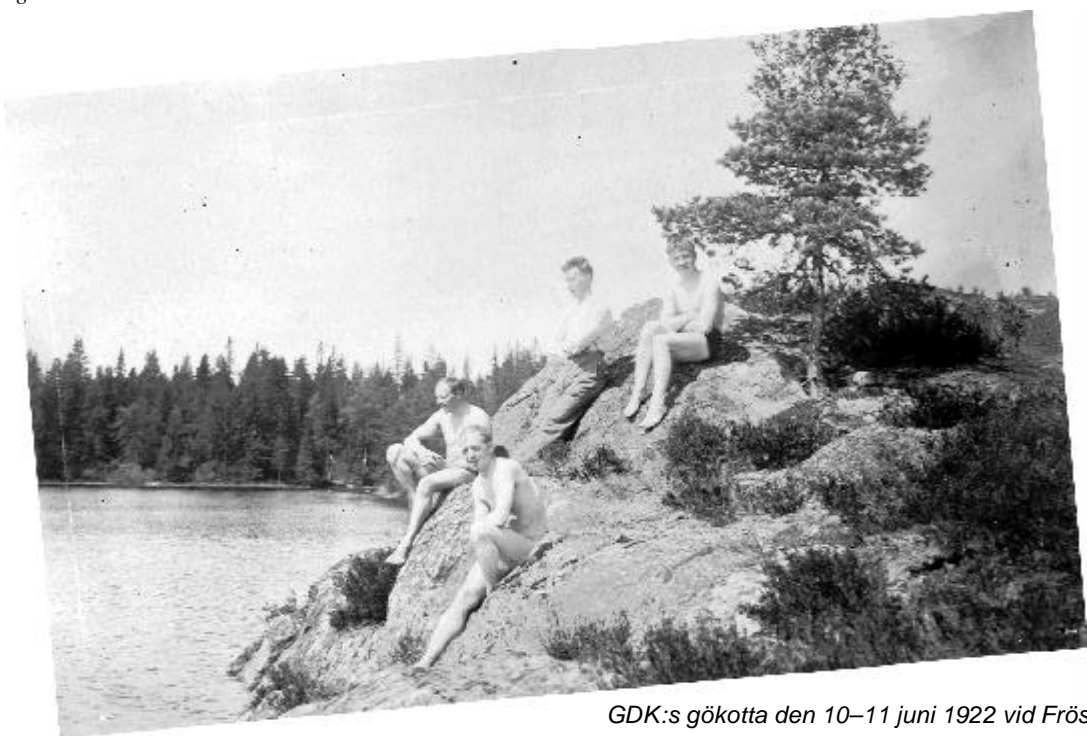
GDK:s gökotta den 10–11 juni 1922 vid Frösvidal.

Och därför, högt ert huvud håll I bröder G.D.K.-are. Ty känt skall bli åt alla håll, ej finns det gossar "blåare" än som i G.D.K. och våra loger stå. Till sist ett "hell" från systrar små - Lyckan följ G.D.K. - .