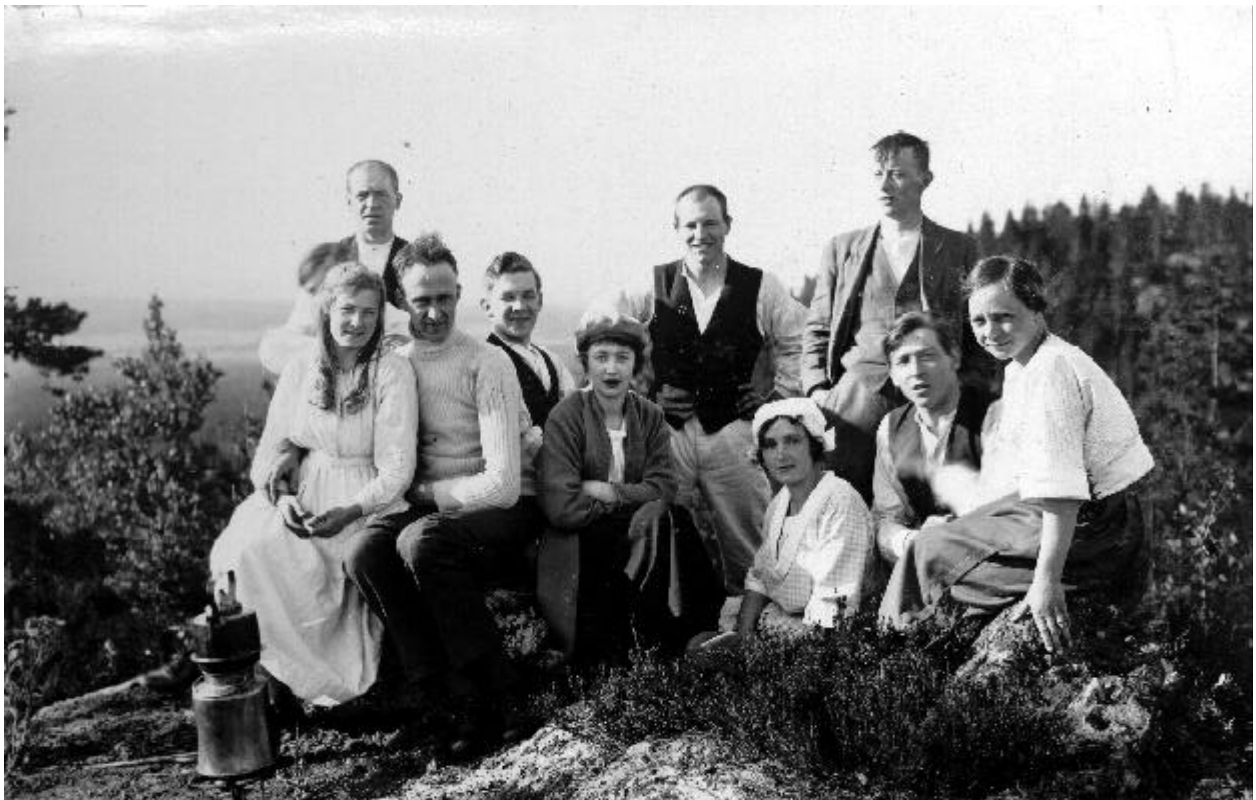
I det tjugonde seklets morgon, Godtemplarnas diskussionsklubb, GDK Örebro, på toppen av Kilsbergen under en gökotta den 10–11 juni 1922.

Medlemsblad från ArkivCentrum Örebro län