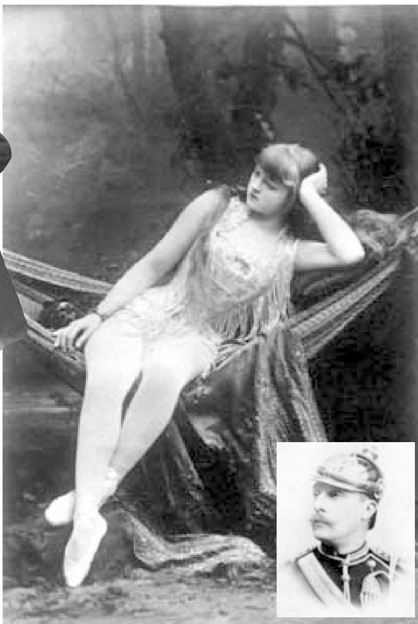
Ovan: Johan Lindström Saxon (1859–1935). T h: lindansösen Hedvig Jensen, mera känd som Elvira Madigan (1867–1889) och dragonlöjtnant Sixten Sparre (1854–1889).