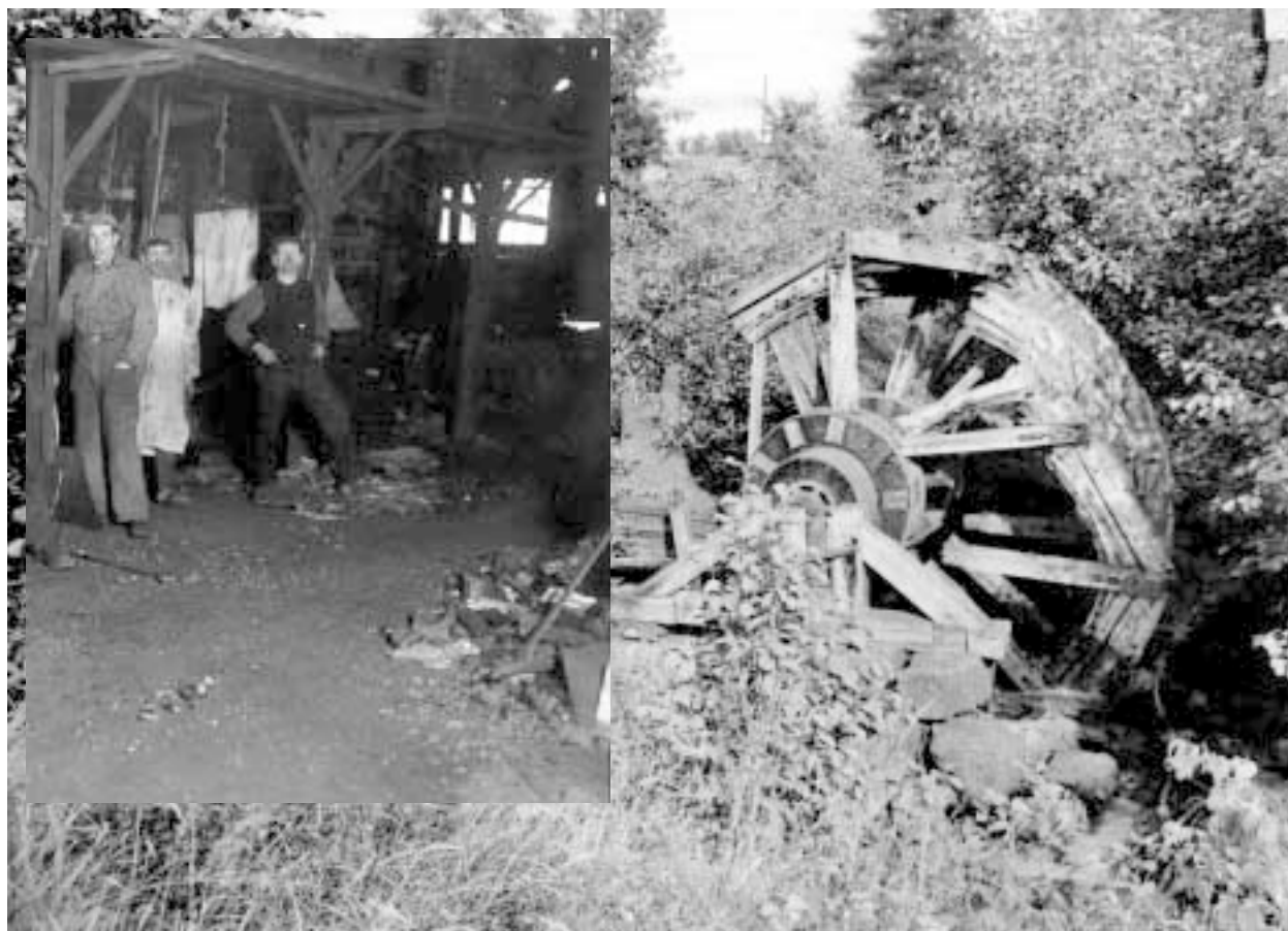
Smeder framför härden i lancashiresmedjan i Rönneshyttan på 1920-talet. I bakgrunden ruinen av Rönneshytte smältsmedjas vattenhjul. Foto: Märta Claréus 1945. Ur Skyllberg 1346 * 1646 * 1946 av Bertil Waldén.