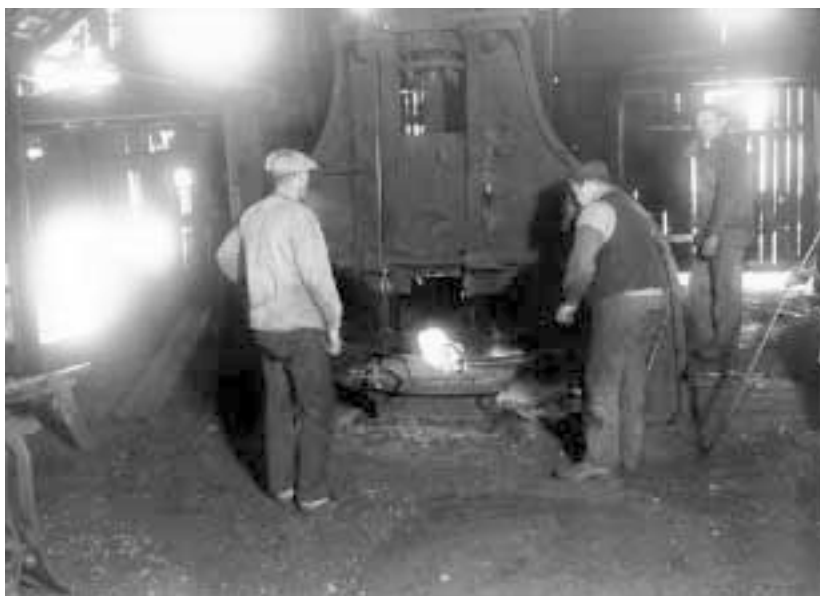
Den färdigbakade smältan läggs under hammaren (från 1920-talet).

var en päronformad järnklump på ca 100 kilo med ett hål för skaftet, som var så tilltaget att där rymdes 3–4 stockar med en längd av omkring 4 meter. Ungefär 2 1/2 meter från hammaren var skaftet avlastat och vilade i två lagerskålar av sten. Hammaren arbetade mot ett massivt städ av järn. Ett underfallsvattenhjul med en diameter på ca 5 meter svarade för driften. Ett annat hjul, som efter behov kunde kopplas till eller från vattenhjulet, var försett med knaster, som slog mot hammarskaftets kortända och på så sätt lyfte hammaren.