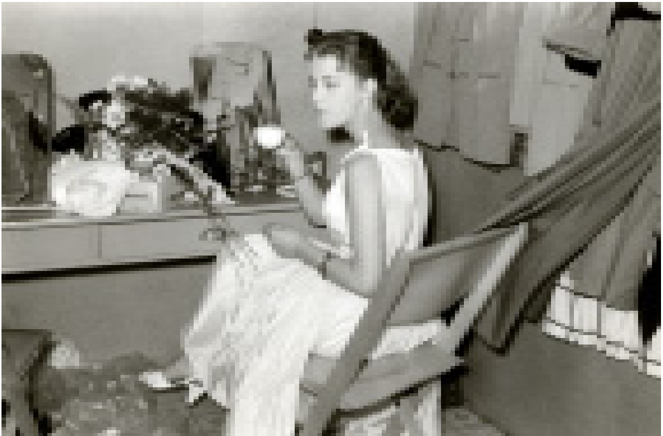
En 16-årig Lill-Babs i Gamleby Folkets Park 1954.