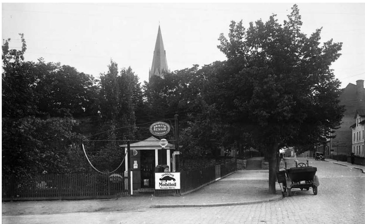
Pratts bensinstation i korsningen Södra Lillåstrand och Storgatan. Ur DVD-skivan »Örebro på glasplåtarnas tid«.