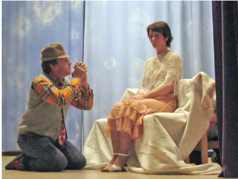
Täby-amatörerna underhöll Folkrörelsearkivets medlemmar på årsmötet 2005 i Glanshammars bygdegård.