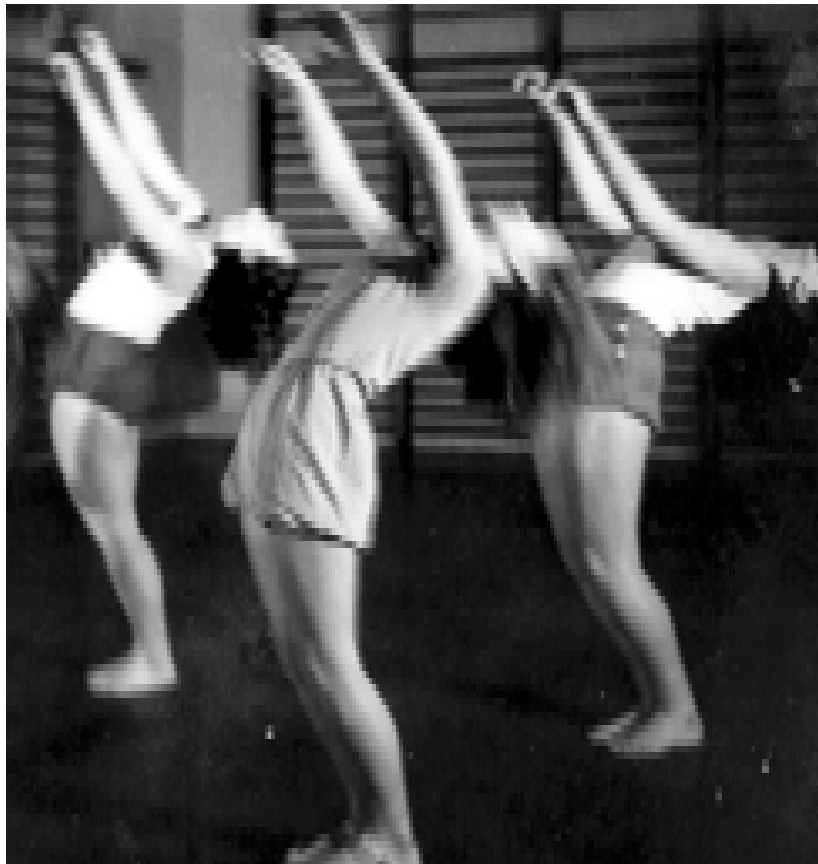
Graciösa flickor i Gymnastikklubben Athenas grupp av 11-16-åringar år 1945.

Öppet måndag, onsdag-fredag kl 08.30-17.00 och tisdagar kl 08.30-20.00