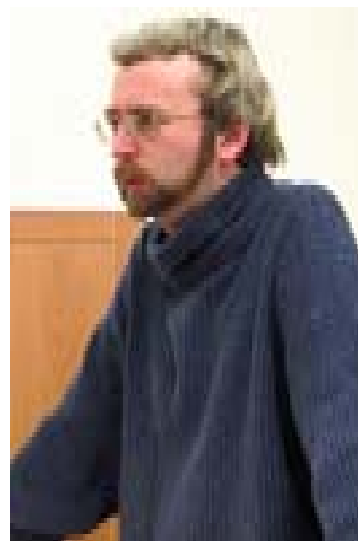
Dick Harrison, vars föreläsningen kan avlyssnas på ArkivCentrums hemsida.

Den 25 januari var det fullt hus på ArkivCentrum. 120 personer hade kommit för att höra den unge historikern Dick Harrison föreläsa om Digerdöden. Harrison , som i december erhöll Augustpriset för sin bok Stora Döden , höll en medryckande och kunskapsrik föreläsning om den katastrof som hemsökte Europa i mitten av 1300-talet. Mellan 30 och 40% av Europas befolkning dog under den svåra pesten! Orsakerna till den upptäcktes av brittiska forskare först under 1890-talet. Föredraget följdes av en livlig diskussion där likheten med vår tids stora farsot, aids, bl a diskuterades. Katastrofernas tid är inte förbi, menade Harrison .