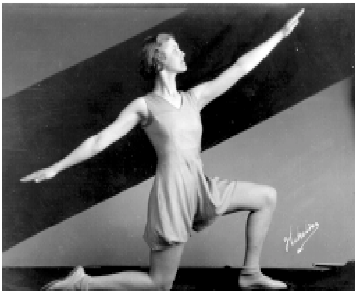
En av De grå, fd Örebro kvinnliga gymnastikförening som fro m 1941 kom att ingå i Gymnastikklubben Athena.

Medlemsblad från ArkivCentrum Örebro län