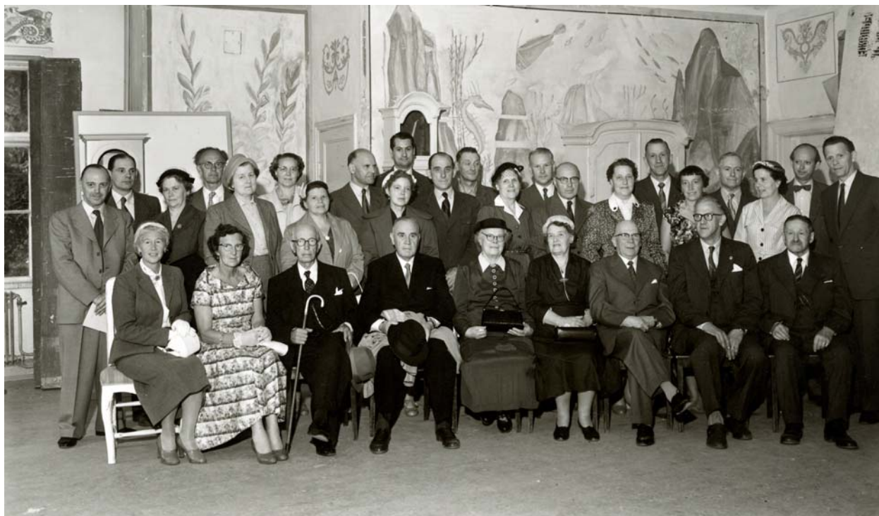
Örebro stads hantverksidkares sjuk- och begravningskassas 100-årsjubileum den 17 juni 1957. Samling i den lokal på Drottninggatan 47 där föreningen stiftades.

stitutioner. Från och med årsskiftet 1998–1999 överfördes organisationens kansli från Stockholms företagsminnen till Örebro läns företagsarkiv. Ett avtal upprättades i samband med detta mellan de två organisationer-